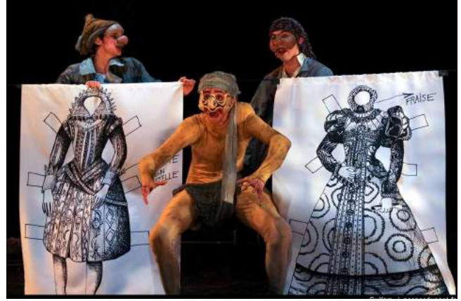
Ci-dessus : La Tempête , de William Shakespeare - Théâtre André Malraux Rueil-Malmaison - Co-mise en scène - 2012