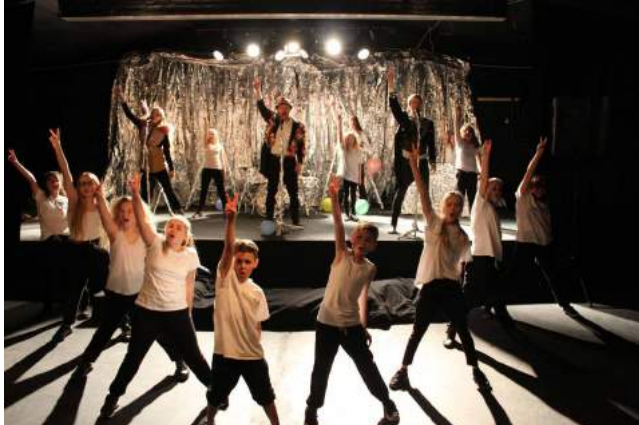
Ci-dessus : Journey to the center of the earth - The Freezer Theatre - Assistant conception et mise en scène - 2016/2017