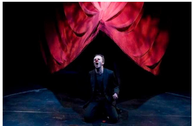
Ci-dessus : Péchés Capitaux / Daudasýndirnar , d'après La Divine Comédie de Dante - Théâtre de la Ville de Reykjavik - Mise en scène - 2008