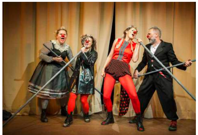
Ci-dessus : Sókrates , Opéra Clown d'après la vie de Socrate - théâtre de la Ville de Reykjavik - Mise en scène - 2015