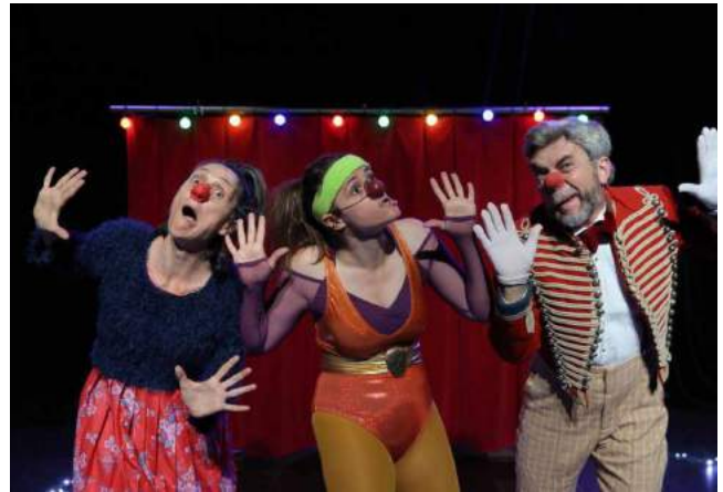
Ci-dessus : Origines - théâtre Clavel Paris - Création collective - 2019