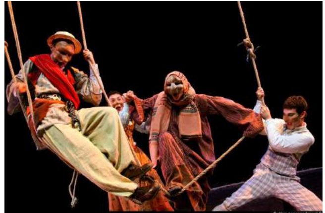
Ci-dessus : Candide d'après Voltaire - Théâtre André Malraux Rueil-Malmaison - Mise en scène - 2010