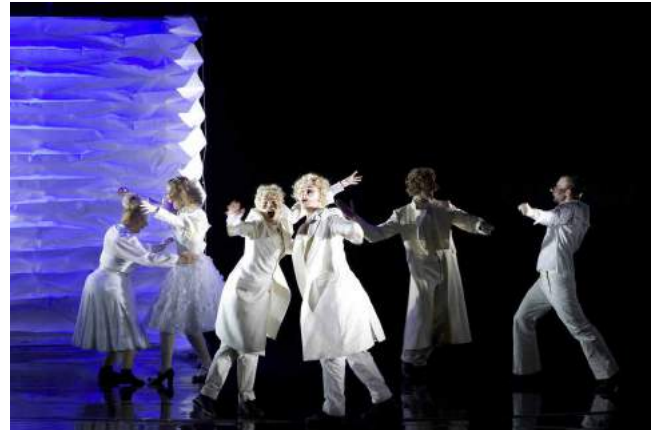
Ci-dessus : The Twelfth Night / La Nuit des Rois de William Shakespeare - Théâtre National d'Islande - Mise en scène - 2009