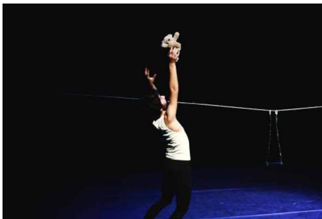
Ci-dessus : Champagne! - Compagnies 101Trüður et Reine Mer - Écriture, conception, mise en scène et interprétation - 2017