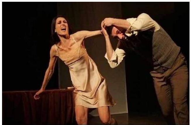
Ci-dessus : Preuve d'amour , de Roberto Arlt - Rueil-Malmaison, Avignon OFF - Mise en scène, Interprétation - 2014